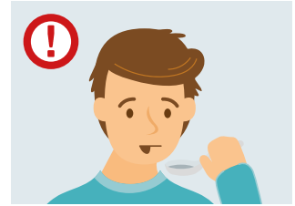
Pakitęs arba dingęs skonio pojūtis arba uoslė

Jei Jums pasireiškė BET KURIS COVID-19 simptomas, Jūs turite atlikti šiuos veiksmus: