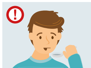
Изменение или потеря вашего чувства вкуса и обоняния